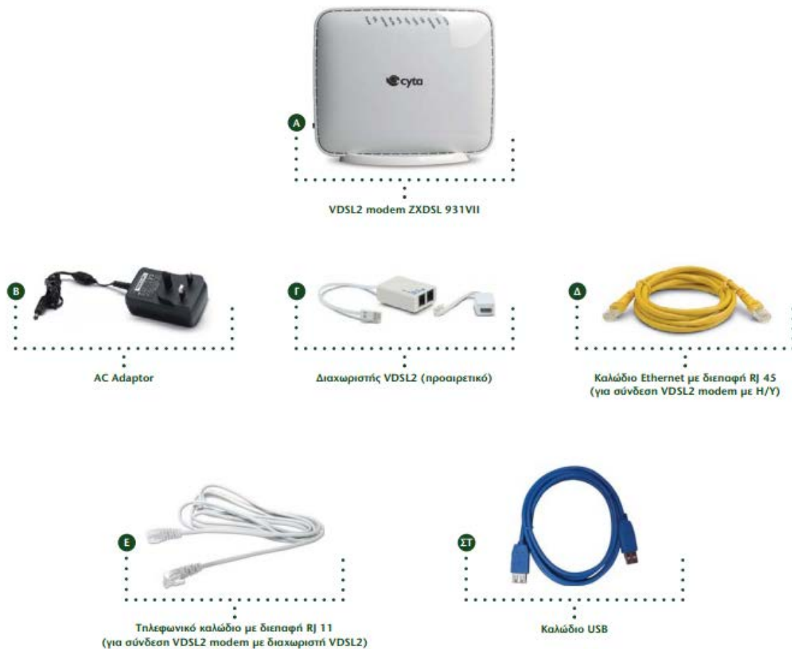
Εικόνα 1: Εξοπλισμός